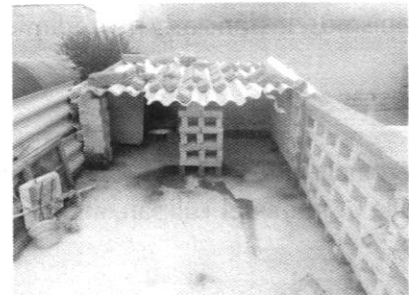
Fotografías 1-3. Ejemplares caninos motivo de denuncia y lugar de alojamiento.