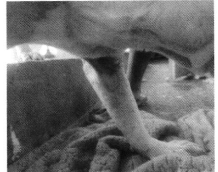
Fotografías 3-6. Aumento de condición corporal, alojamiento limpio y herida sanada.

En virtud de lo antes expuesto, esta Entidad considera procedente emitir la presente resolución, de conformidad con el artículo 27 fracción VII de la Ley Orgánica de esta Procuraduría, por el cumplimiento voluntario de las disposiciones jurídicas en materia de bienestar animal.