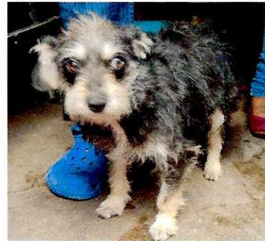
Fotografías 1 y 2. Ejemplares denunciados.

En seguimiento de lo anterior, personal de esta Subprocuraduría llevó a cabo una nueva visita de reconocimiento de hechos con la finalidad de dar seguimiento a las recomendaciones antes mencionadas; sin embargo, no fue posible observarlas, toda vez que en entrevista con un habitante del inmueble refirió que los caninos habían sido reubicados al Estado de México, por lo anterior, permitió el acceso y no se observó la existencia de ningún ejemplar canino.