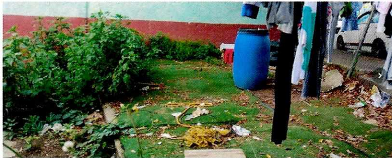
Fotografía 3.- Se aprecia que en dicho sitio no hay animales de compañía.

En seguimiento de lo anterior, personal de esta Subprocuraduría llevó a cabo una nueva visita de reconocimiento de hechos con la finalidad de dar seguimiento a las recomendaciones antes mencionadas; sin embargo, no fue posible observarlas, toda vez que en entrevista con un habitante del inmueble refirió que los caninos habían sido reubicados al Estado de México, por lo anterior, permitió el acceso y no se observó la existencia de ningún ejemplar canino.