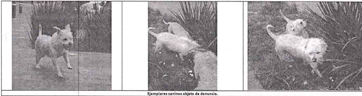
Ejemplares caninos objeto de denuncia.

PROCURADURÍA AMBIENTAL Y DEL ORDENAMIENTO TERRITORIAL DE LA CIUDAD DE MÉXICO SUBPROCURADURÍA AMBIENTAL, DE PROTECCIÓN Y BIENESTAR A LOS ANIMALES