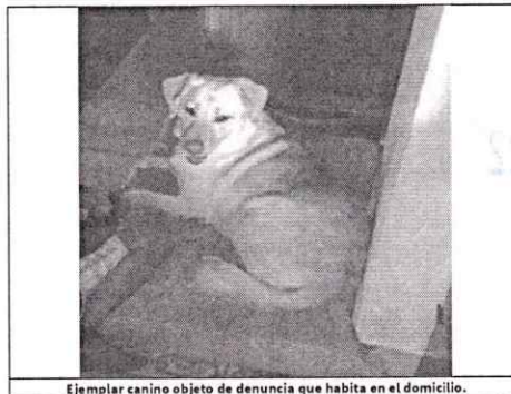
Ejemplar canino objeto de denuncia que habita en el domicilio.

Con base en lo antes citado, esta Entidad considera que una vez que se dio atención a la presente denuncia por parte del personal adscrito a esta Subprocuraduría, se está en aptitud de emitir la resolución administrativa que conforme a derecho proceda, esto de acuerdo con la fracción VI del artículo 27 de la Ley Orgánica de la Procuraduría Ambiental y del Ordenamiento Territorial de la Ciudad de México, por imposibilidad legal, al no constatar irregularidades en materia de bienestar animal.