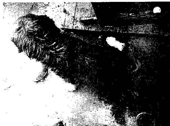
Fotografías 1-2. Vistas del ejemplar canino.