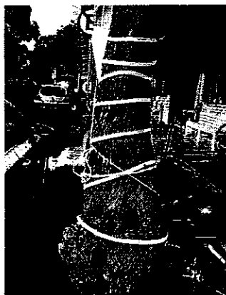
Figuras 1-2. Se observan los objetos que fueron colocados en los fustes de los individuos arbóreos.