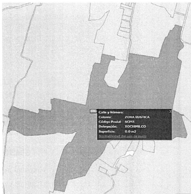
Imagen obtenida del SIG-CiudadMX de SEDUVI de poligonal de catastro del polígono correspondiente al sitio objeto de denuncia.

Adicionalmente a lo anterior, personal de esta Entidad visualizó la versión digital simplificada del Inventario de Asentamientos Humanos Irregulares, consultada en el SIG-PAOT "Sistema de Información del Patrimonio Ambiental y Urbano de la CDMX", a la cual se sobrepone la poligonal del sitio objeto de denuncia, sin que el sitio se localice dentro de algún asentamiento registrado. -----