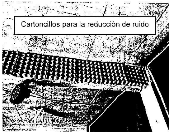
Cartoncillos para la reducción de ruido