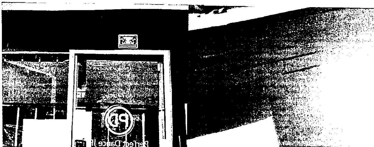
Aislante acústico (esponja) sobre placas de poliestireno