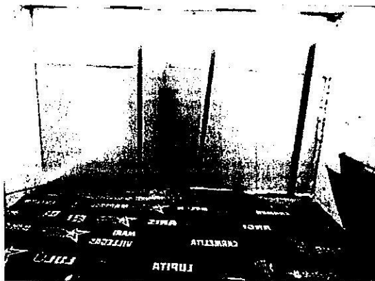
Estructura de madera para el soporte de placas de poliestireno expandido, sellado de juntas de espuma expansiva de poliuretano

EXPEDIENTE: PAOT-2022-2317-SOT-563 Y ACUMULADOS PAOT-2022-3732-SOT-998, PAOT-2022-6141-SOT-1536 Y PAOT-2023-3015-SOT-876