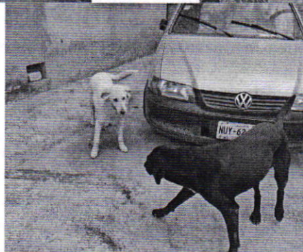
Figuras 1, 2 y 3. Ejemplares denunciados y el alimento que consumen.

Es de resaltar que, en el Acuerdo de Admisión, que fue enviado por correo electrónico a la persona denunciante, se le hizo de conocimiento que contaba con un término de seis días hábiles para aportar las pruebas que estimara pertinentes en la investigación de los hechos, lo anterior conforme al artículo 90 del Reglamento de la Ley Orgánica de la Procuraduría Ambiental y del Ordenamiento Territorial de la Ciudad de México; sin embargo durante el procedimiento de investigación, no fueron proporcionados elementos de prueba que pudieran determinar incumplimiento a la normatividad en materia de bienestar animal.