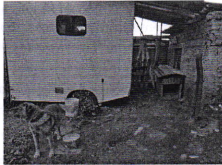
Figura 2. Vista del ejemplar canino motivo de denuncia.

constatando que la persona encargada del cuidado del canino llevó a cabo la extensión de la longitud de la correa a la cual se encuentra atado su animal de compañía, midiendo cuatro metros por lo que le permite tener mayor movilidad, de igual manera fue reubicado su sitio de alojamiento a un espacio techado; sin embargo, por su tamaño no le permite ingresar a la misma, por lo que nuevamente se hizo la recomendación de llevar a cabo el acondicionamiento de dicho espacio y no mantenerlo amarrado permanentemente.