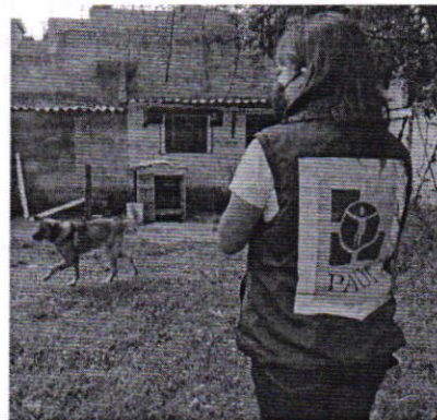
Figuras 3 y 4. Vista del ejemplar canino motivo de denuncia y de su sitio de resguardo.

En virtud de lo antes expuesto, esta Entidad considera procedente emitir la presente resolución, de conformidad con el artículo 27 fracción VII de la Ley Orgánica de esta Procuraduría, por el cumplimiento voluntario de las disposiciones jurídicas en materia de bienestar animal.