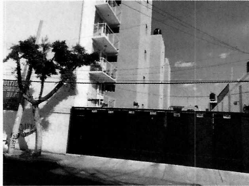
Fotografía 1. Fachada del inmueble

En este sentido, de las constancias que obran en el presente expediente, se desprende que personal de esta Subprocuraduría llevó a cabo una visita de reconocimiento de hechos, de acuerdo a lo establecido en el artículo 15 BIS 4 fracción IV de la Ley Orgánica de esta Entidad, diligencia durante la cual se tuvo la atención de personal de vigilancia de la unidad habitacional quien refirió que para poder permitir el acceso al sitio se requería la autorización de la persona habitante del inmueble, sin embargo, ésta no se encontraba en el domicilio al momento de la visita; de igual manera, el vigilante indicó desconocer si en el departamento en comento contaban con algún ejemplar canino, no obstante, se notificó el citatorio correspondiente mediante instructivo.