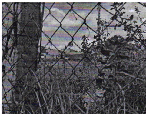
Figuras 1 y 2. Vista del sitio motivo de denuncia.

En seguimiento a la denuncia, mediante oficio PAOT-05-300/210-0861-2021, se solicitó a la persona denunciante proporcionara mayor información en cuanto al número interior de la vivienda que habitan los ejemplares caninos motivo de denuncia; otorgándole un término de cinco días hábiles; sin embargo, dicho requerimiento no fue atendido.