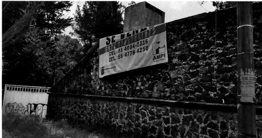
Fotografía 1. Fachada del inmueble

Cabe indicar que durante la diligencia se constató la presencia de esquilmos que presentaban condiciones de intemperismo, así como diversos individuos arbóreos que presentaban cortes antiguos y recientes, así como otros árboles que mostraban señales de quema en la parte inferior de sus troncos, sin embargo, no se pudo constatar si la base de estos se encontrara afectada.