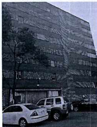
Lugar de los hechos denunciados

Asimismo, resulta aplicable la Norma Ambiental para el Distrito Federal NADF-005-AMBT-2013, que establece las condiciones de medición y los límites máximos permisibles de emisiones sonoras de aquellas actividades o giros que para su funcionamiento utilicen maquinaria, equipo, instrumentos, herramienta, artefactos o instalaciones que generen emisiones sonoras al ambiente.