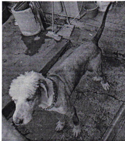
Figuras 3 y 4. Vista del ejemplar canino motivo de denuncia.

En virtud de lo antes expuesto, esta Entidad considera procedente emitir la presente resolución, de conformidad con el artículo 27 fracción VII de la Ley Orgánica de esta Procuraduría, por el cumplimiento voluntario de las disposiciones jurídicas en materia de bienestar animal.