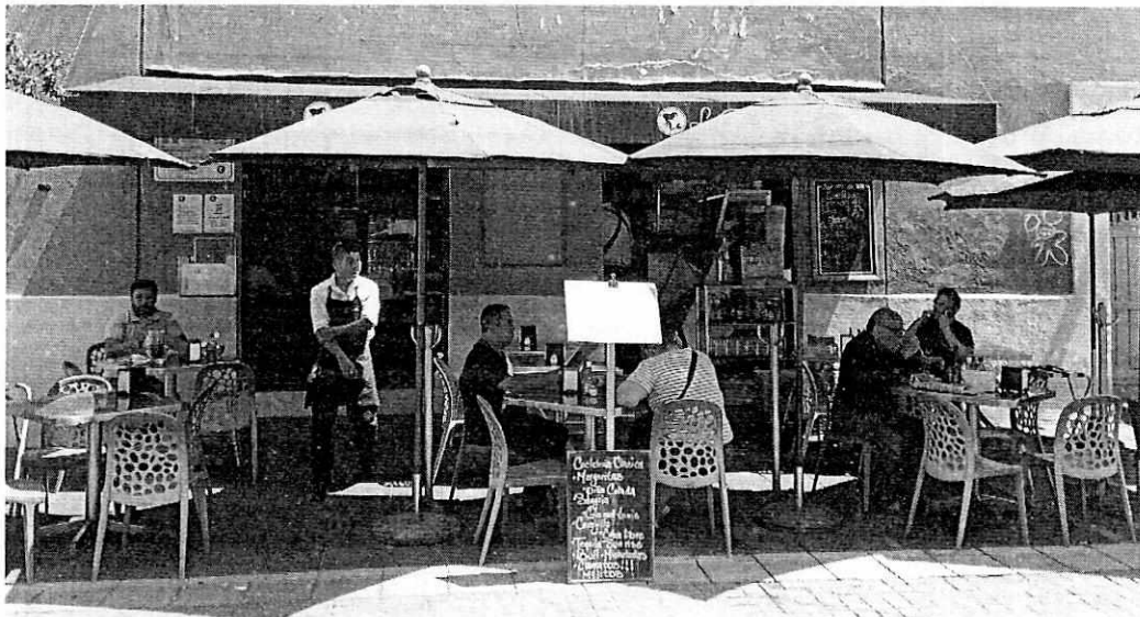
Fachada del establecimiento mercantil en funcionamiento y abierto al público.