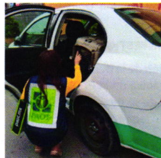
Figuras 1 y 2. Ejemplar canino motivo de denuncia.

Por lo antes referido, y toda vez que el animal de compañía no contaba con las condiciones de bienestar adecuadas, mediante la promoción del cumplimiento voluntario de las disposiciones jurídicas en materia de bienestar animal, facultad conferida a esta Entidad en el artículo 5 fracción XIX de la Ley Orgánica de esta Procuraduría, es que la persona responsable del cuidado del ejemplar canino, hizo entrega voluntaria del canino “Chilindrina”, a personal de esta Subprocuraduría, a efecto de que le sean brindados los cuidados de bienestar animal correspondientes. Por lo cual la PAOT hizo entrega de ambos ejemplares a una protectora independiente, quien se comprometió a proporcionar los cuidados correspondientes; al respecto, remitió evidencia fotográfica del carnet de vacunación actualizado y del lugar en el cual deambula libremente.