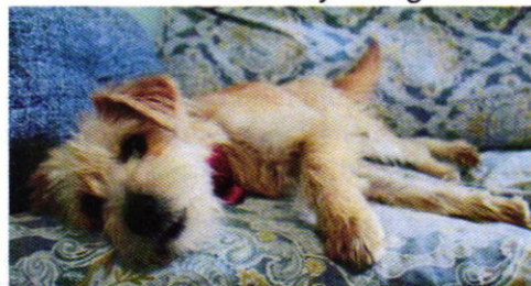
Figura 3. Ejemplar canino motivo de denuncia.

Por lo antes referido, y toda vez que el animal de compañía no contaba con las condiciones de bienestar adecuadas, mediante la promoción del cumplimiento voluntario de las disposiciones jurídicas en materia de bienestar animal, facultad conferida a esta Entidad en el artículo 5 fracción XIX de la Ley Orgánica de esta Procuraduría, es que la persona responsable del cuidado del ejemplar canino, hizo entrega voluntaria del canino “Chilindrina”, a personal de esta Subprocuraduría, a efecto de que le sean brindados los cuidados de bienestar animal correspondientes. Por lo cual la PAOT hizo entrega de ambos ejemplares a una protectora independiente, quien se comprometió a proporcionar los cuidados correspondientes; al respecto, remitió evidencia fotográfica del carnet de vacunación actualizado y del lugar en el cual deambula libremente.