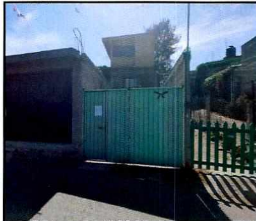
Imagen 1. Fachada del domicilio denunciado.

Posteriormente se llevó a cabo una nueva visita en donde se tuvo comunicación con una persona habitante del domicilio quien mencionó que no contaban con animales en el interior del domicilio. Cabe señalar que el personal de la PAOT constató que efectivamente no había algún ejemplar con las características descritas en la denuncia al interior del domicilio en cuestión.