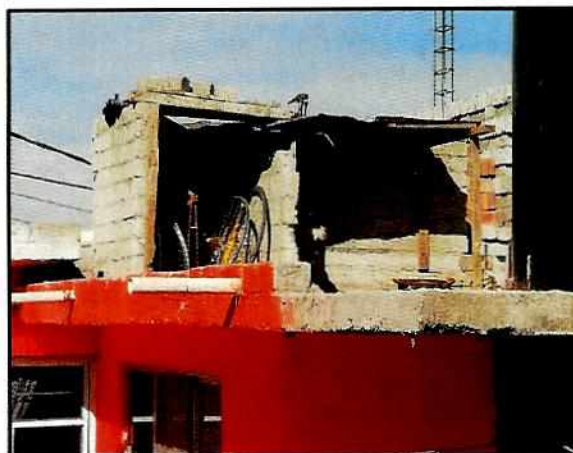
Imagen 2. Sitio de alojamiento deteriorado.

En seguimiento de lo anterior, personal de esta Subprocuraduría llevó a cabo una nueva visita de reconocimiento de hechos con la finalidad de dar seguimiento a las recomendaciones antes mencionadas, constatando que la persona encargada del cuidado del canino llevó a cabo las recomendaciones realizadas por personal de esta Entidad.