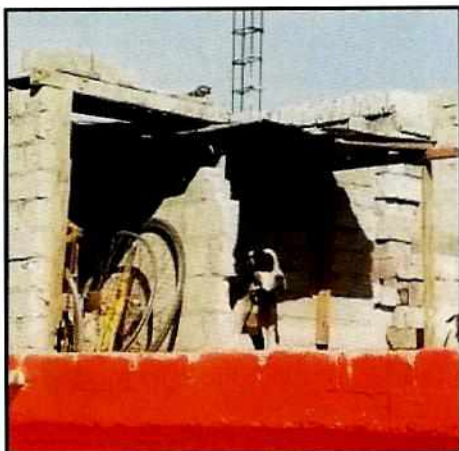
Imagen 1. Ejemplar canino de nombre Kya"