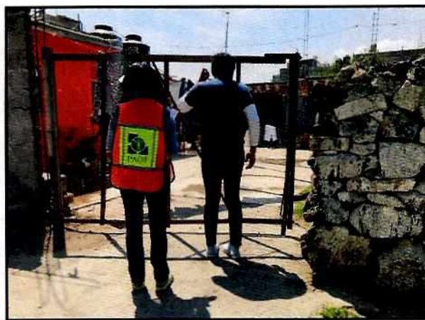
Imagen 1. Fachada del lugar donde fue reubicado el cánido

En virtud de lo antes expuesto, esta Entidad considera procedente emitir la presente resolución, de conformidad con el artículo 27 fracción VII de la Ley Orgánica de esta Procuraduría, por el cumplimiento voluntario de las disposiciones jurídicas en materia de bienestar animal.