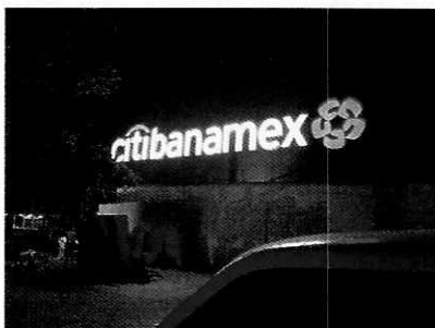
Se muestra el establecimiento denunciado.

Por otra parte de acuerdo a las documentales que obran en el presente expediente, se desprende que personal de esta Subprocuraduría realizó tres reconocimientos de hechos de acuerdo a lo establecido en el artículo 15 BIS 4 fracción IV de la Ley Orgánica de esta Entidad, diligencias en las cuales desde la vía pública no se constató la existencia de emisiones sonoras por la activación de la alarma del banco denunciado.