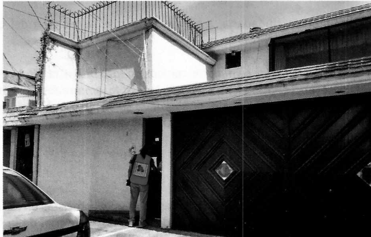
Fotografía 1. Fachada del inmueble señalado como el de los hechos denunciados

En este sentido, personal de esta Subprocuraduría realizó cuatro reconocimientos de hechos en el sitio señalado por la persona denunciante, de acuerdo a lo establecido en el artículo 15 BIS 4 fracción IV de la Ley Orgánica de esta Entidad, en las cuales se percibieron ladridos de dos ejemplares caninos; asimismo, durante las diligencias, se notificó el citatorio correspondiente, a efecto de que el propietario de los ejemplares motivo de investigación manifestara lo que a su derecho le conviniera; sin embargo, ninguno de estos citatorios fue atendido.