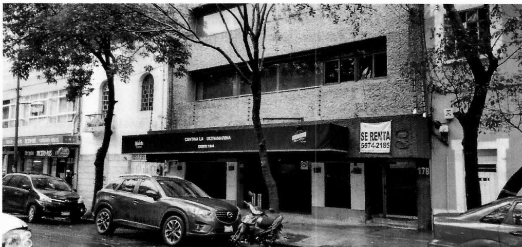
Fotografía 1. Fachada del establecimiento mercantil motivo de denuncia

En este sentido, de las constancias que obran en el presente expediente, se desprende que personal de esta Subprocuraduría se constituyó en el domicilio de la persona denunciante en la fecha y hora acordada previamente con ésta, constatando que el establecimiento mercantil motivo de investigación se encontraba funcionando, no obstante, éste no estaba generando emisiones sonoras susceptibles de medición acústica, por lo que la persona denunciante señaló que consideraba innecesario realizar la medición de ruido en las condiciones encontradas.