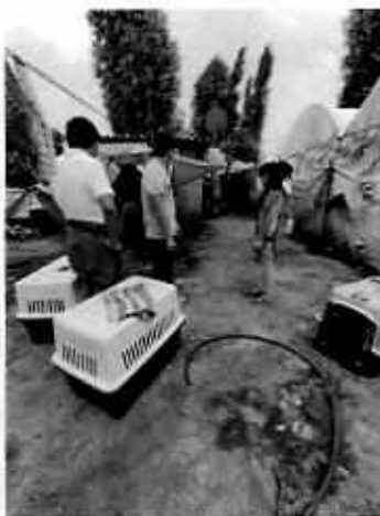
Imagen 4. Limpieza del lugar.