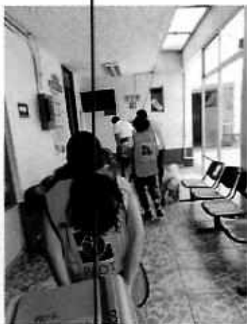
Imagen 3. Esterilización de apoyo.

En seguimiento de lo anterior, personal de esta Subprocuraduría llevó a cabo una nueva visita de reconocimiento de hechos con la finalidad de dar seguimiento a las recomendaciones antes mencionadas, constatando que la persona encargada del cuidado de los caninos realizó lo recomendado por personal de esta Entidad.