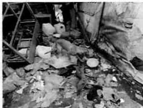
Imagen 1 y 2. Lugar motivo de denuncia.

En seguimiento de lo anterior, personal de esta Subprocuraduría llevó a cabo una nueva visita de reconocimiento de hechos con la finalidad de dar seguimiento a las recomendaciones antes mencionadas, constatando que la persona encargada del cuidado de los caninos realizó lo recomendado por personal de esta Entidad.