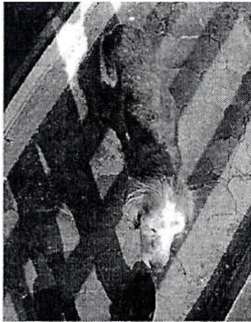
Fotografía 1. Se observa ejemplar canino de raza cocker (geriátrico), de condición corporal 2.5/5