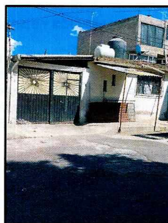
Imagen 2. Fachada del inmueble en donde se encontraba el ejemplar.