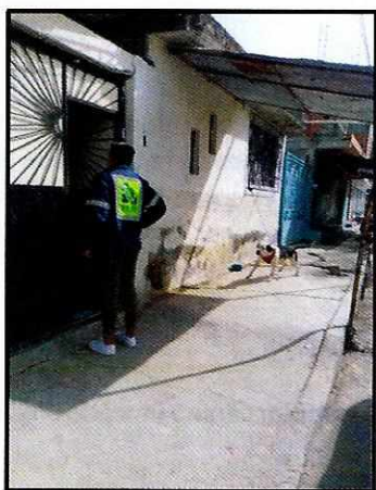
Imagen 1. Ejemplar canino motivo de denuncia.