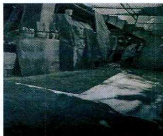
Imagen 2. Vista en el interior del domicilio no se constató la presencia de animal de compañía

Es de señalar que en la misma calle existía otro inmueble con el número 55, sin embargo no coincidía con las características descritas en el escrito de denuncia.