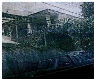
Imagen 1. Fachada del domicilio referido

En este sentido, de las constancias que obran en el presente expediente, se desprende que personal de esta Subprocuraduría llevó a cabo una visita de reconocimiento de hechos, de acuerdo a lo establecido en el artículo 15 BIS 4 fracción IV de la Ley Orgánica de esta Entidad, diligencia durante la cual una persona habitante del lugar donde se denunciaron los hechos objeto de la presente investigación, hizo de conocimiento al personal adscrito a esta Subprocuraduría que el ejemplar canino que fue señalado en el escrito de la denuncia, ya no se encuentra en el inmueble, lo anterior toda vez que no cuentan con ningún ejemplar canino desde hace tiempo. Cabe señalar que el personal de la PAOT constató que efectivamente no había algún ejemplar con las características descritas en la denuncia al interior del domicilio en cuestión.