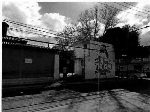
Lugar de los hechos denunciados

En este sentido, de las constancias que obran en el presente expediente, se desprende que personal de esta Subprocuraduría llevó a cabo una visita de reconocimiento de hechos, de acuerdo a lo establecido en el artículo 15 BIS 4 fracción IV de la Ley Orgánica de esta Entidad, diligencia durante la cual se constató el funcionamiento de un establecimiento con giro de auto lavado, de nombre comercial "carWASH" y se tuvo la atención de una persona de sexo masculino, donde se le entregó el oficio correspondiente conminándolo a cumplir con lo señalado en la normatividad ambiental vigente aplicable, toda vez que durante la visita se constataron los hechos que motivaron la denuncia, pues el establecimiento se encontraba abierto y en funcionamiento.