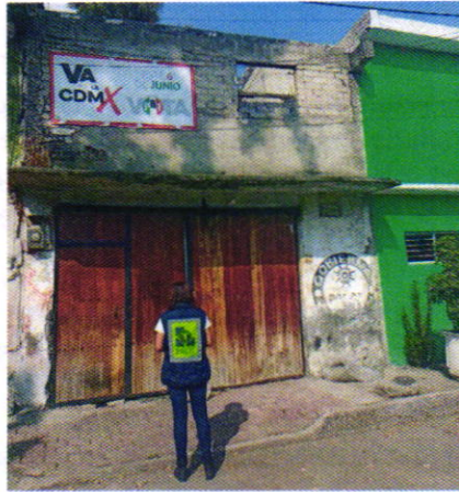
Figura 3. Vista del sitio motivo de denuncia.

que fueron señalados en el escrito de la denuncia, ya no se encuentran en el inmueble, lo anterior toda vez que las personas que rentaban dicha vivienda se retiraron del lugar, llevándose consigo a sus animales de compañía. Cabe señalar que el personal de la PAOT desde el espacio público no constató la existencia de algún ejemplar canino, ladridos provenientes del interior del inmueble en comento u olores característicos de su presencia.