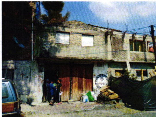
Figura 2. Vista del sitio motivo de denuncia.

En seguimiento a la denuncia, personal de esta Subprocuraduría llevó a cabo una nueva visita de reconocimiento de hechos durante la cual se entrevistaron con una persona habitante del sitio de referencia, quien se negó a permitir el acceso a la vivienda; no obstante, se notificó el oficio PAOT-05-300/210-2042-2019, con la finalidad de que la persona propietaria de los ejemplares motivo de denuncia se comunicara con personal de esta Entidad.