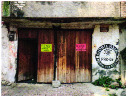
Figura 1. Vista del sitio referido en el escrito de denuncia.

BIS 4 fracción IV de la Ley Orgánica de esta Entidad, diligencia durante la cual desde el espacio público se constató la existencia de un ejemplar canino el cual deambulaba libremente en el patio del inmueble de referencia, así como los ladridos de al menos tres animales de compañía localizados al interior del sitio; sin embargo, no fue posible ingresar al domicilio en cuestión, toda vez que la persona que atendió al personal actuante se negó a permitir el acceso al mismo.