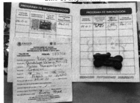
Cartilla de vacunación