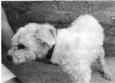
Corte de pelo