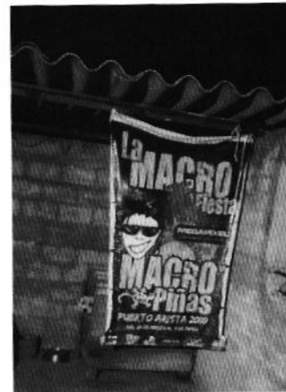
Sitio de alojamiento