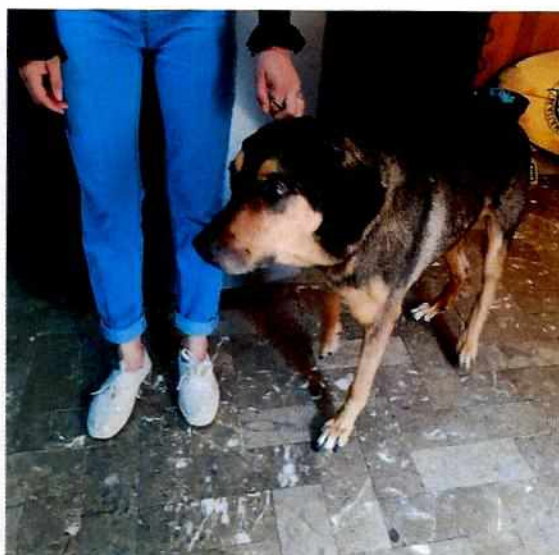
Fotografías 1-2. Ejemplares denunciados.

Es de resaltar que, en el Acuerdo de Admisión, que fue enviado por correo electrónico a la persona denunciante, se le hizo de conocimiento que contaba con un término de seis días hábiles para aportar las pruebas que estimara pertinentes en la investigación de los hechos, lo anterior conforme al artículo 90 del Reglamento de la Ley Orgánica de la Procuraduría Ambiental y del Ordenamiento Territorial de la Ciudad de México; sin embargo durante el procedimiento de investigación, no fueron proporcionados elementos de prueba que pudieran determinar incumplimiento a la normatividad en materia de bienestar animal.