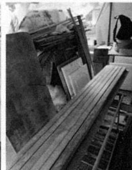
Fotografías 1 a 4. Se muestra vista general del taller de carpintería, así como área de trabajo

Por lo anterior, se realizó una consulta en el Sistema de Información Geográfica de la Secretaría de Desarrollo Urbano y Vivienda de la Ciudad de México (SIG-SEDUVI/CDMX), de la cual se desprendió que conforme al Programa Delegacional de Desarrollo Urbano vigente para la Alcaldía Coyoacán, al predio en cuestión le aplica la zonificación HM/4/30 (Habitacional Mixto, 4 niveles máximos de altura, 30% mínimo de área libre) en el cual el uso de suelo para la producción artesanal o microindustrial de carpintería y ebanistería se encuentra permitido.