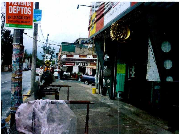
Fotografía 1. Fachada del inmueble.

En este sentido, de las constancias que obran en el presente expediente, se desprende que personal de esta Subprocuraduría llevó a cabo una visita de reconocimiento de hechos, de acuerdo a lo establecido en el artículo 15 BIS 4 fracción IV de la Ley Orgánica de esta Entidad, diligencia durante la cual, personal de esta Procuraduría se entrevistó con la encargada del negocio a quien se le informó la normatividad ambiental en materia de emisiones sonoras, asimismo, se constataron las emisiones sonoras generadas por la maquinaria del negocio. Cabe señalar que se le notificó el citatorio correspondiente; derivado del cual se presentó a comparecer, acto en el cual se comprometió a tomar acciones respecto a la emisión de música.