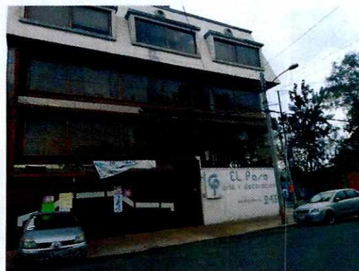
Fotografía 1. Fachada del inmueble.

artículo 15 BIS 4 fracción IV de la Ley Orgánica de esta Entidad, diligencia durante la cual no se percibieron emisiones sonoras provenientes del negocio, toda vez que se encontraba cerrado; no obstante se dejó citatorio mediante instructivo fijado en la puerta. En atención a dicho oficio compareció la responsable del negocio quien refirió que se encontraba en la mejor disposición de realizar adecuaciones en caso de encontrarse por encima de los decibeles permitidos.