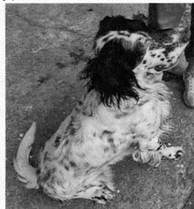
Fotografías 1 a 3. Fachada y ejemplar canino motivo de denuncia

Medellín 202, piso 4, colonia Roma Norte Alcaldía Cuauhtémoc, C.P. 06000, Ciudad de México Tel. 5265 0780 ext. 12011 Y 12400