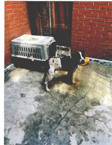
Ejemplar canino de nombre "Terry"

En seguimiento a la denuncia se realizó una segunda visita de reconocimiento de hechos en donde se observó que el ejemplar canino pitbull de nombre "Terry" ya no se encontraba en el aérea común y al momento de abordar al responsable del canino, nos mencionó que fue reubicado de lugar en donde se encontraba libre de manera permanente, y a decir del segundo ejemplar de nombre "Tomás" se observó en condiciones adecuadas de bienestar, tal como se observó que en la primera visita.