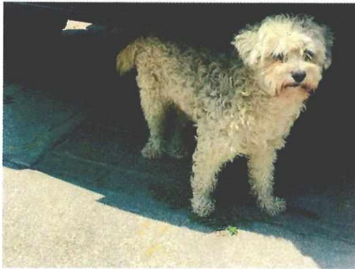
Imagen 1. Ejemplar canino de nombre "Tomás"