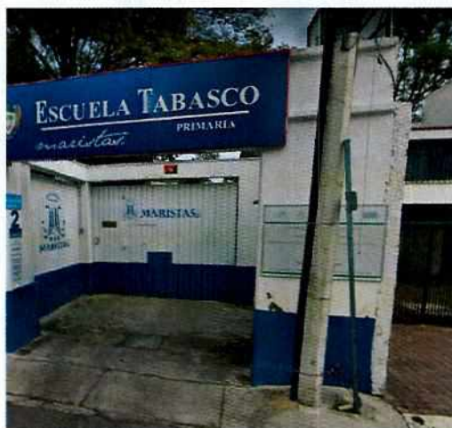
Fotografía 1. Fachada del inmueble motivo de denuncia.

En este sentido, de las constancias que obran en el presente expediente, se desprende que personal de esta Subprocuraduría llevó a cabo una visita de reconocimiento de hechos, de acuerdo a lo establecido en el artículo 15 BIS 4 fracción IV de la Ley Orgánica de esta Entidad, diligencia durante la cual una persona del sexo femenino refirió ser la secretaria de la Directora, manifestando que los hechos referidos en el citatorio que se le estaba notificando se trataban de un evento deportivo interno de la misma institución educativa, el cual era aislado, negando la renta de las instalaciones a terceros, no obstante, informaría a la Directora, para que ésta pudiera presentarse a comparecer e indicar lo conducente; es de señalar, que en dicha visita, no se constataron emisiones sonoras.