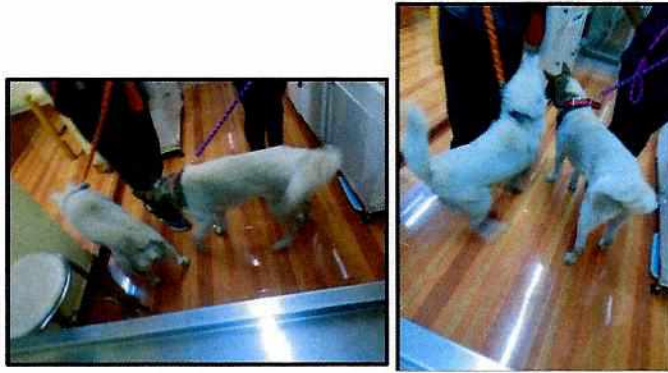
Imagen 1. Ejemplares caninos motivo de denuncia.

Es de resaltar que, en el Acuerdo de Admisión, que fue enviado por correo electrónico a la persona denunciante, se le hizo de conocimiento que contaba con un término de seis días hábiles para aportar las pruebas que estimara pertinentes en la investigación de los hechos, lo anterior conforme al artículo 90 del Reglamento de la Ley Orgánica de la Procuraduría Ambiental y del Ordenamiento Territorial de la Ciudad de México; sin embargo durante el procedimiento de investigación, no fueron proporcionados elementos de prueba que pudieran determinar incumplimiento a la normatividad en materia de bienestar animal.