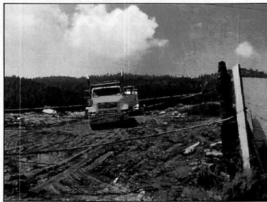
Vista del frente del predio en el que se localiza el tiro (desde la Carretera Federal México-Toluca).

Por lo anterior, se sostuvo reunión de trabajo con personal de la Secretaría de Comunicaciones y Transportes (SCT), así como de la empresa "CAABSA" (constructora del proyecto "Tren Interurbano"), en la que se deslindaron de los hechos denunciados ante esta Entidad, y presentaron imágenes satelitales obtenidas del sitio web "Google Earth", en las que se observa que el tiro se localiza en el predio de interés desde el año 2009.