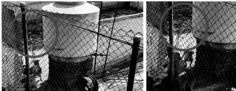
Fotografías 1 y 2. Se resalta gran acumulación de residuos en el sitio de alojamiento

En seguimiento de lo anterior, personal de esta Subprocuraduría llevó a cabo una nueva visita de reconocimiento de hechos con la finalidad de dar seguimiento a las recomendaciones antes mencionadas, constatando que la persona encargada del cuidado de los caninos llevó a cabo las recomendaciones realizadas por personal de esta Entidad.