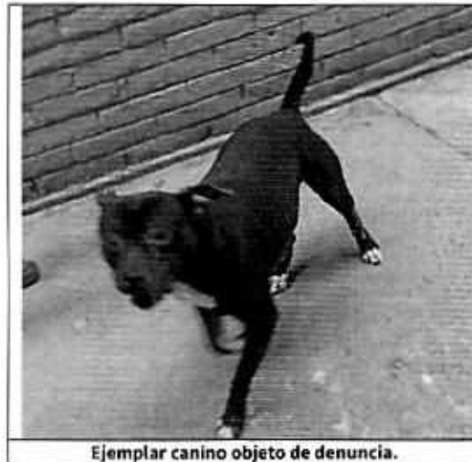
Ejemplar canino objeto de denuncia.

No. Folio: PAOT-05-300/200- 1 4 1 5 2 -2021