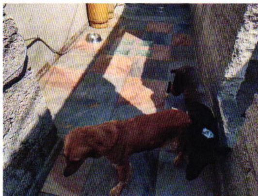
Fotografía 1, inmueble y ejemplares caninos motivos de denuncia.