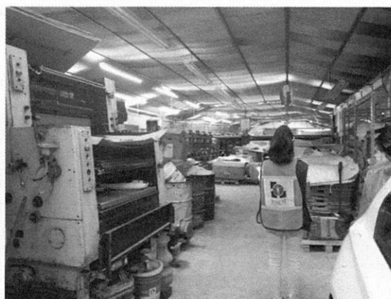
Fotografías 1 y 2. Se muestra fachada e interior del taller objeto de denuncia.

Medellín 202, piso 4, colonia Roma Norte Alcaldía Cuauhtémoc, C.P. 06700, Ciudad de México Tel. 5265 0780 ext. 12011 y 12400