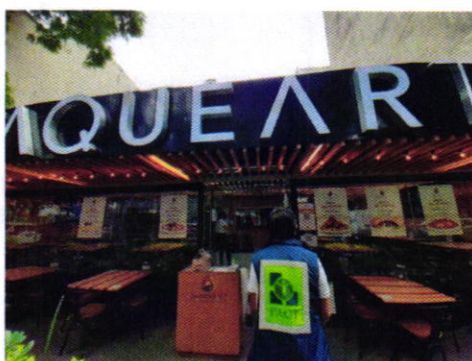
Figura 1. Vista del establecimiento mercantil motivo de denuncia.

En este sentido, de las constancias que obran en el presente expediente, se desprende que personal de esta Procuraduría llevó a cabo una visita de reconocimiento de hechos, de acuerdo a lo establecido en el artículo 15 BIS 4 fracción IV de la Ley Orgánica de esta Entidad, diligencia durante la cual nos entrevistamos con una persona que se ostentó como gerente del establecimiento mercantil denominado "TAQUEARTE", quien permitió el acceso al mismo, sitio en el cual se observó el funcionamiento de un extractor; sin embargo, no se constató la generación de emisiones sonoras que fueran susceptibles de medición acústica; no obstante, procedimos a notificar el oficio PAOT-05-300/200-2557-2021.