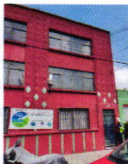
Figura 1. Vista del sitio referido en el escrito de denuncia.

maullidos provenientes del interior del sitio de referencia u olores característicos de la presencia de dicho animal.