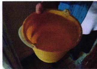
Figuras 1, 2 y 3. Ejemplar denunciado y objetos utilizados por el mismo.

Es de resaltar que, en el Acuerdo de Admisión, que fue enviado por correo electrónico a la persona denunciante, se le hizo de conocimiento que contaba con un término de seis días hábiles para aportar las pruebas que estimara pertinentes en la investigación de los hechos, lo anterior conforme al artículo 90 del