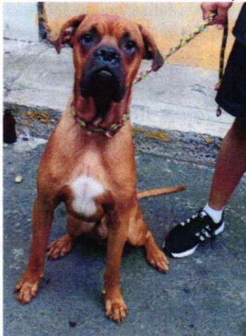
Figura 1. Ejemplar denunciado.

Es de resaltar que, en el Acuerdo de Admisión, que fue enviado por correo electrónico a la persona denunciante, se le hizo de conocimiento que contaba con un término de seis días hábiles para aportar las pruebas que estimara pertinentes en la investigación de los hechos, lo anterior conforme al artículo 90 del Reglamento de la Ley Orgánica de la Procuraduría Ambiental y del Ordenamiento Territorial de la Ciudad de