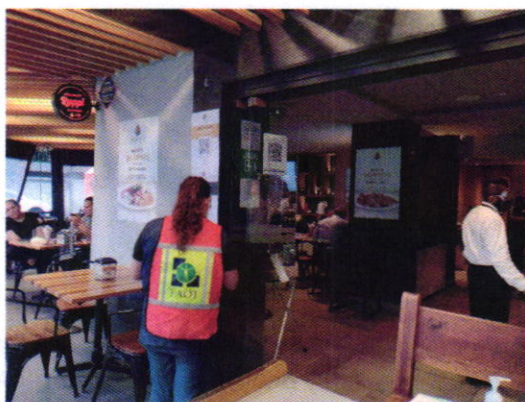
Figura 1. Vista del establecimiento mercantil motivo de denuncia.

En este sentido, de las constancias que obran en el presente expediente, se desprende que personal de esta Procuraduría llevó a cabo una visita de reconocimiento de hechos, de acuerdo a lo establecido en el artículo 15 BIS 4 fracción IV de la Ley Orgánica de esta Entidad, diligencia durante la cual desde el espacio público se observó que el establecimiento mercantil denominado "TAQUEARTE" se encontraba en funcionamiento; sin embargo, desde el espacio público no se constató la generación de emisiones sonoras por el funcionamiento de un extractor que fueran susceptibles de medición acústica; no obstante, procedimos a fijar en la puerta del sitio en comento, mediante instructivo el oficio PAOT-05-300/200-1730-2021.