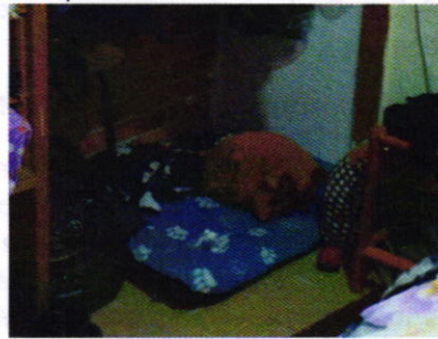
Figuras 1 y 2. Ejemplar denunciado y la colchoneta utilizada por su descanso.

Es de resaltar que, en el Acuerdo de Admisión, que fue enviado por correo electrónico a la persona denunciante, se le hizo de conocimiento que contaba con un término de seis días hábiles para aportar las pruebas que estimara pertinentes en la investigación de los hechos, lo anterior conforme al artículo 90 del Reglamento de la Ley Orgánica de la Procuraduría Ambiental y del Ordenamiento Territorial de la Ciudad de México; sin embargo durante el procedimiento de investigación, no fueron proporcionados elementos de prueba que pudieran determinar incumplimiento a la normatividad en materia de bienestar animal.