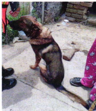
Figura 1. Ejemplar denunciado.