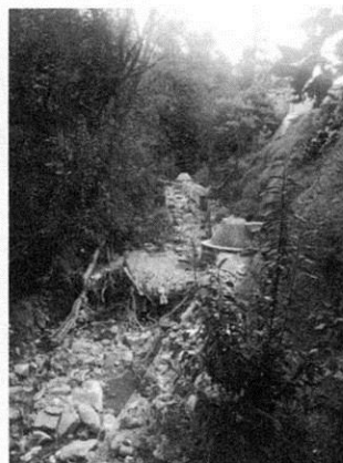
Fotografías 1 y 2. Se muestra parte del tramo afectado

Derivado de lo antes señalado, el artículo 10 fracciones IV y VII de la Ley Ambiental de Protección a la Tierra en el Distrito Federal, señala que corresponde a cada una de las demarcaciones territoriales de la Ciudad de México, lo siguiente: