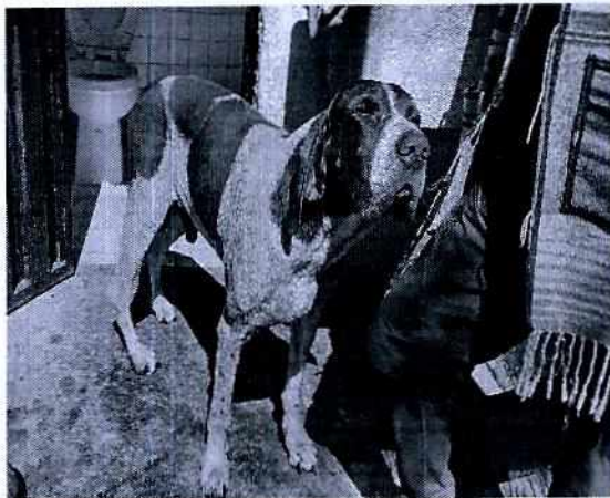
Fotografía 1. Ejemplar canino observado

En este sentido, de las constancias que obran en el expediente en el que se actúa, se desprende que personal de esta Subprocuraduría realizó los reconocimientos de hechos correspondientes, constatando la existencia de un ejemplar canino (un macho con los rasgos físicos de la raza Pointer Inglés) con las siguientes características: